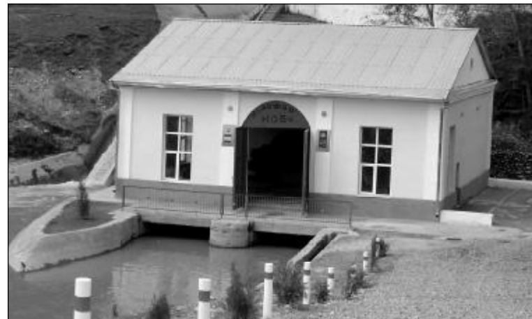
НОБ-и хурди «Нурофар»

- То ба қор даромадани ГЭС-и деҳа баъзан бегоҳ 3 соат барқ меоданд, баъзан намедоданд. Як сол пеш, тӯли 2 моҳи зимистон тамомам барқ надода буданд. Ҳоло дар давоми 24 соат рӯшанӣ ҳаст. Мо метаво-